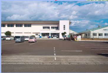
志摩市浜島B&Q海洋センター