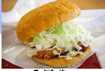
勝っおばーがあー