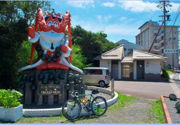
黒崎小公園の伊勢えびの王様