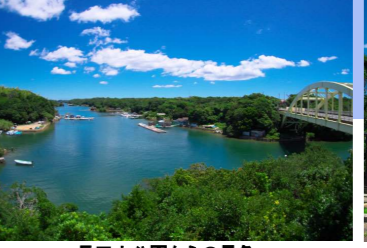
長田小公園からの景色